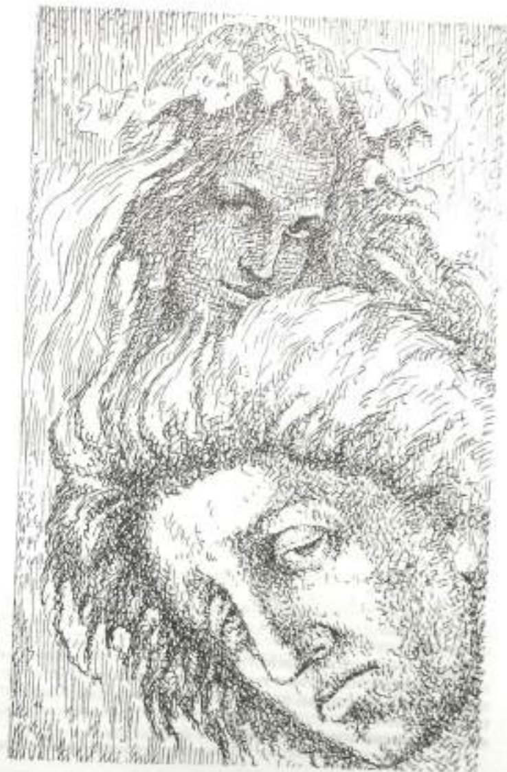
Поэзия А. Блока. Иллюстрация А. Н. Белова