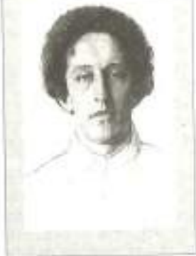
Александр Александрович БЛОК (1880—1921)