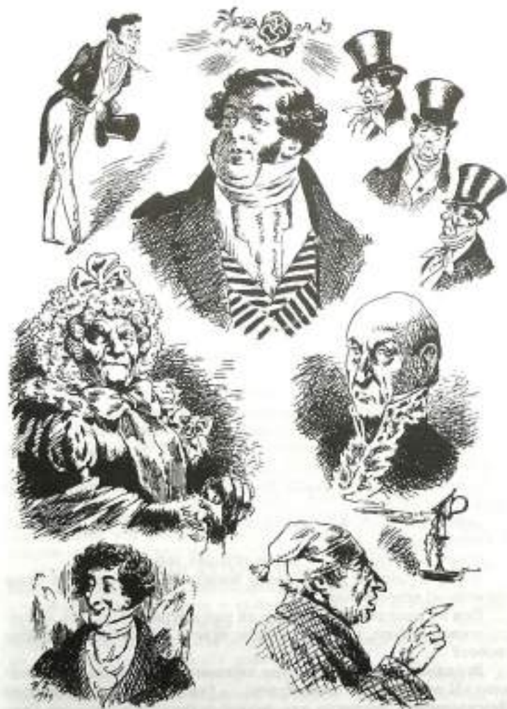
«Горе от ума». Иллюстрация Н. В. Кузьмина

257. (Режиссер нумерует стихи комедии. — Сост. ) «И точно начал свет глупеть, / Сказать вы можете вздохнувши...»