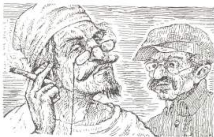
«Собачье сердце». Иллюстрация А. Н. Белова

в человека. Так появляется Полиграф Полиграфович Шариков 1 (имя и фамилию избрал себе сам «новорожденный»).