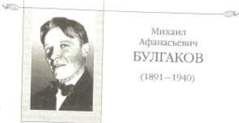
Михаил Афанасьевич БУЛГАКОВ

Как бы вы ответили на вопрос: что привлекает внимание читателя к поэзии Сергея Есенина?