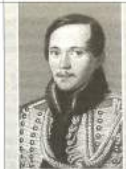
Михаил Юрьевич ЛЕРМОНТОВ (1814—1841)

Можно ли приписать образы Моцарта и Сальери к «злым образам» мировой литературы? Если можно, то почему?