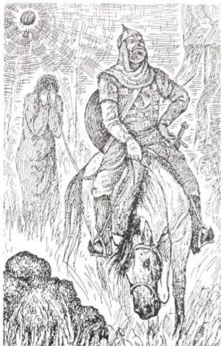
«Слово о полку Игореве». Иллюстрация А. Н. Белова

«Слово...» насыщено народной поэзией, что делает его еще более лиричным. В нем «славы» (прославления) сочетаются с «плачами» — те и другие написаны в духе устного народного творчества. «Близка к народным плачам лирическая песня Ярославны. <...> Сон Святослава полон устно-поэтических символов. <...> Народного богатыря напоминает Всеволод Буй-Тур, когда он «прыщет» на врагов стрелами, гремит об их шлемы мечами харалужными. Подобно Илье Муромцу, Всеволод Буй-Тур сражается с врагами, и, куда поскачет, там лежат поганые головы половецкие. <...> Народная стихия в «Слове...» выражается в отрицательных метафорах («У Немги кровавые берега не добром были посеяны — посеяны костями русских сынов»), в некоторых чисто фольклорных эпитетах (чистое поле, серые волки, острые мечи, синее море, каменные стрелы, быстрые кони, черный ворон, красные девы и др.), в характерных для народной поэзии образах, особенно многочисленных в плаче Ярославны и в сне Святослава Киевского, в аллитерациях, в отдельных гиперболах, сравнениях и т. д.» (Д. С. Лихачев. «Слово о полку Игореве». Историко-литературный очерк. 1976).